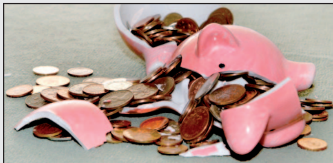
De gemeente wil de spaarpot plunderen om het masterplan te realiseren. Dat is een visie die de N-VA niet onderschrijft.

Op alle bestuurlijke niveaus zijn belastingverhogingen en besparingen schering en inslag. Gemeenten hangen aan de alarmbel: verschillende gemeenten zien zich verplicht de broeksriem fors aan te halen. Sommigen gaan zelfs over tot belangrijke inkrimpingen van dienstverlening en personeel. Wie weet bovendien wat voor extra verplichtingen en inkrimpingen de gemeenten nog boven het